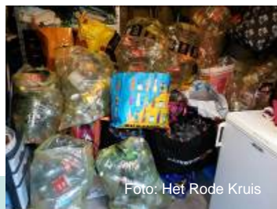
tassen met lege flessen

5. Lees het stukje onder het kopje Flash Brigade nog eens goed. Waarom is de Flash Brigade bedacht?